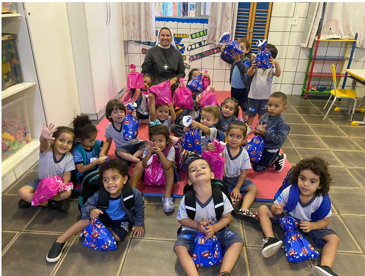
Semana da Criança