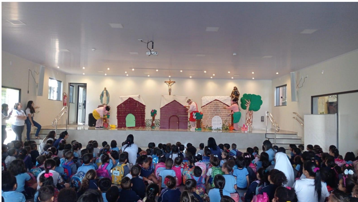
Semana do livro e da biblioteca