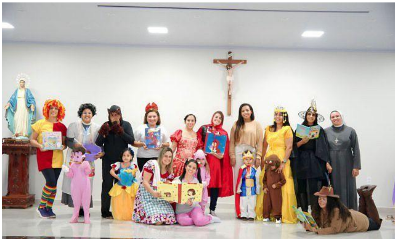
Visita da administradora de Brazlândia e dia da bike