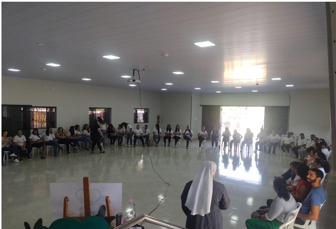
Dia de formação para profissionais da Educação Infantil