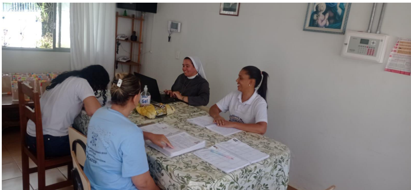
Conselho de Classe