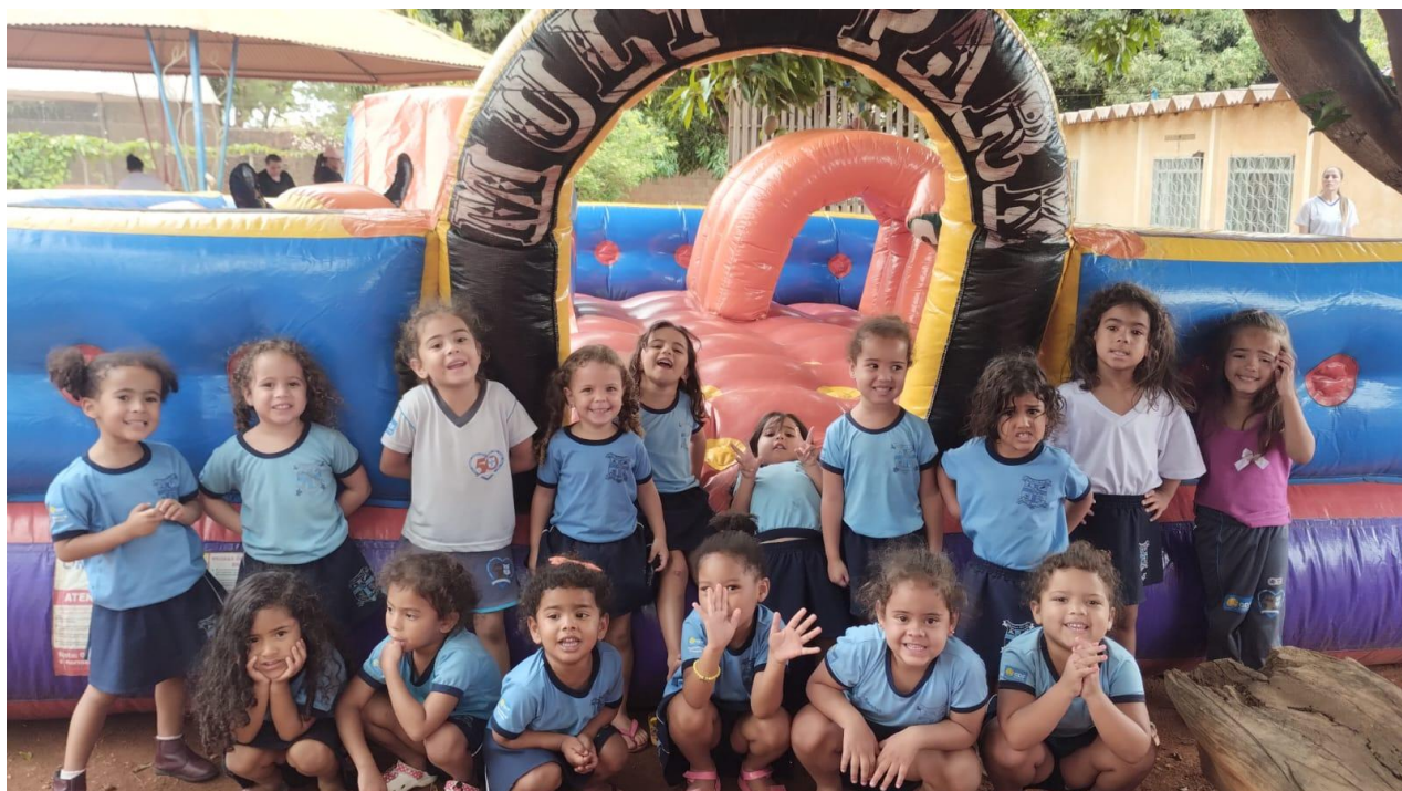
Semana da Criança