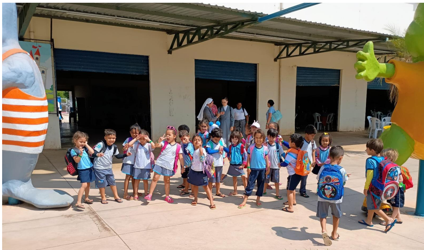
Passeio ao Parque aquático