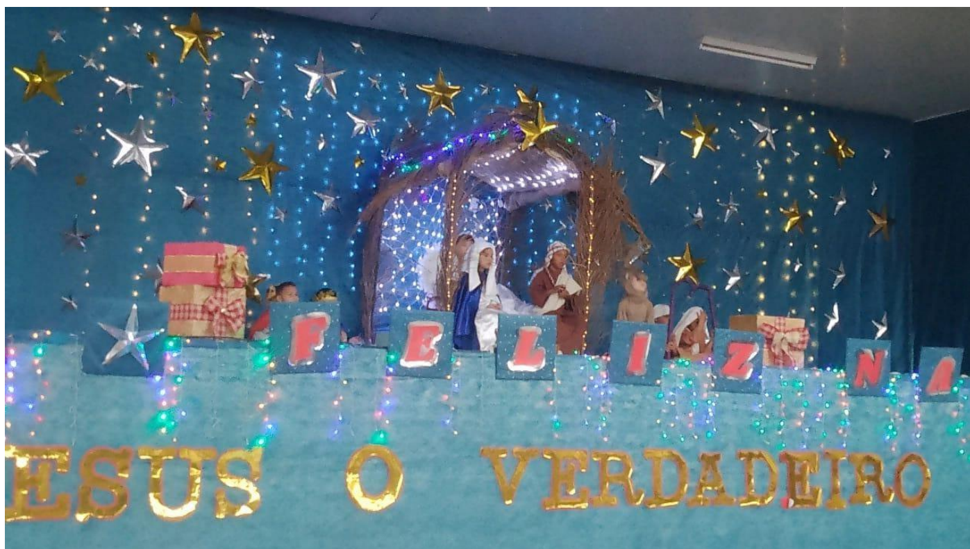
Auto de Natal