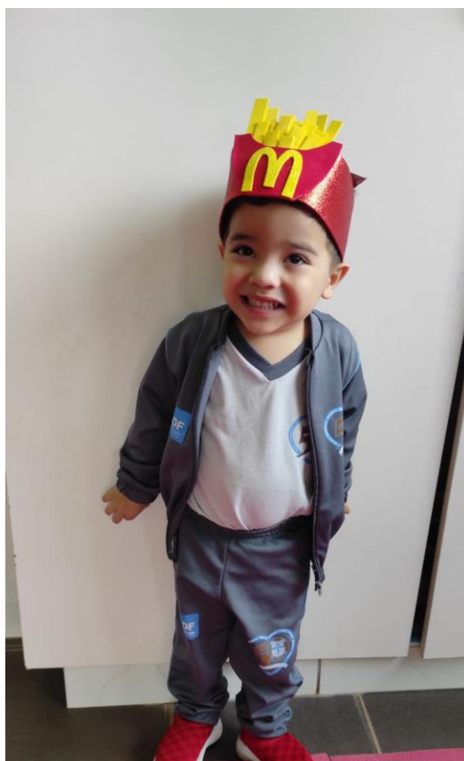
Semana da Criança