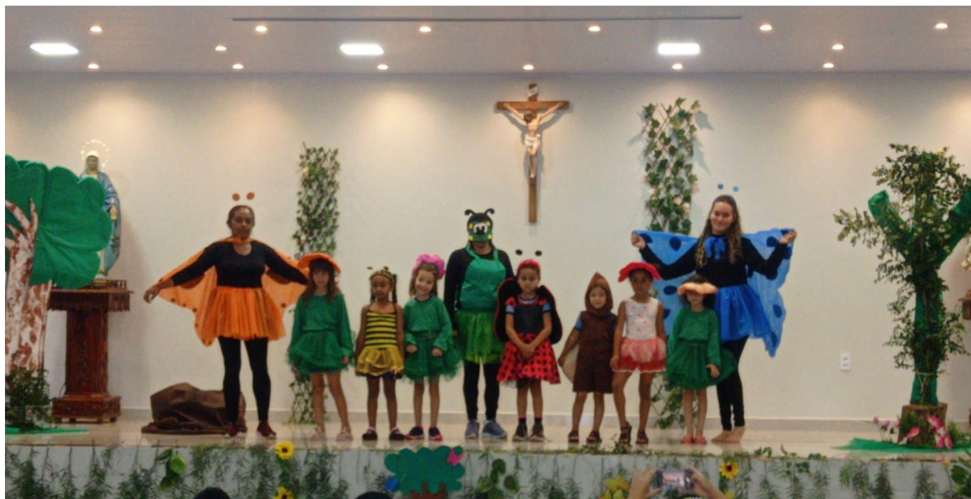
Semana do livro e da biblioteca