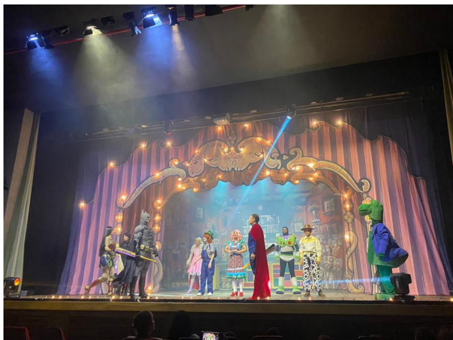
Semana da Criança