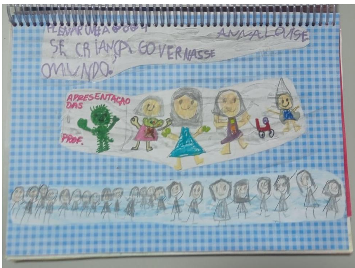
Registros dos portfólios