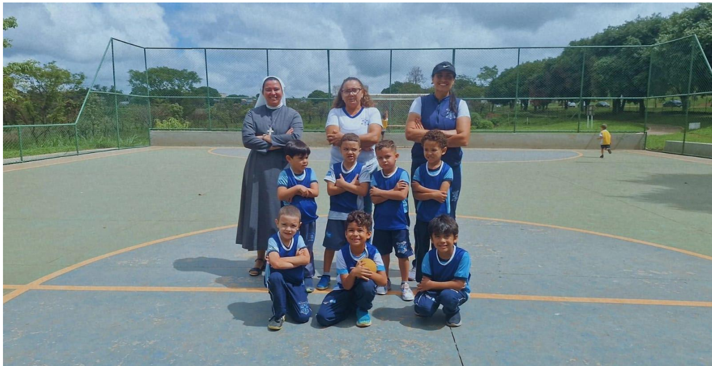
Projeto transição e campeonato de handebol