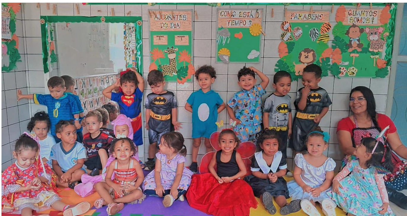
Semana da Criança