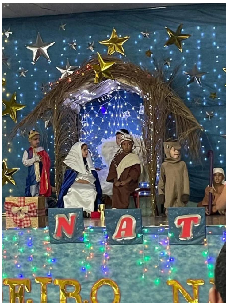
Auto de Natal