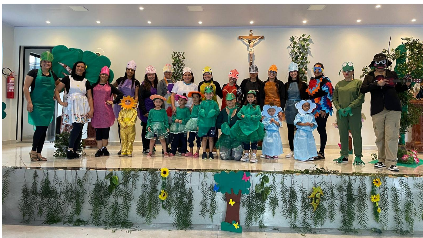
Semana do livro e da biblioteca