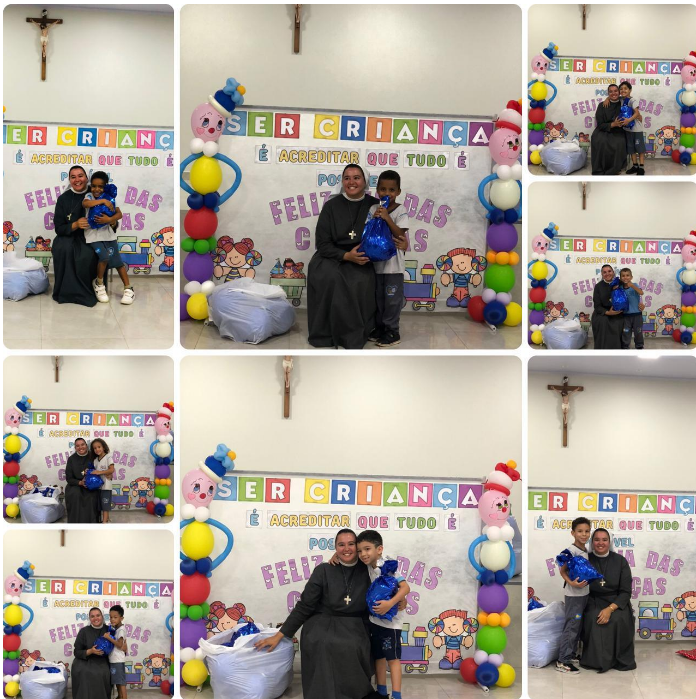
Semana da Criança