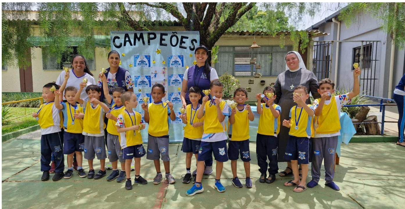
Projeto transição e campeonato de handebol