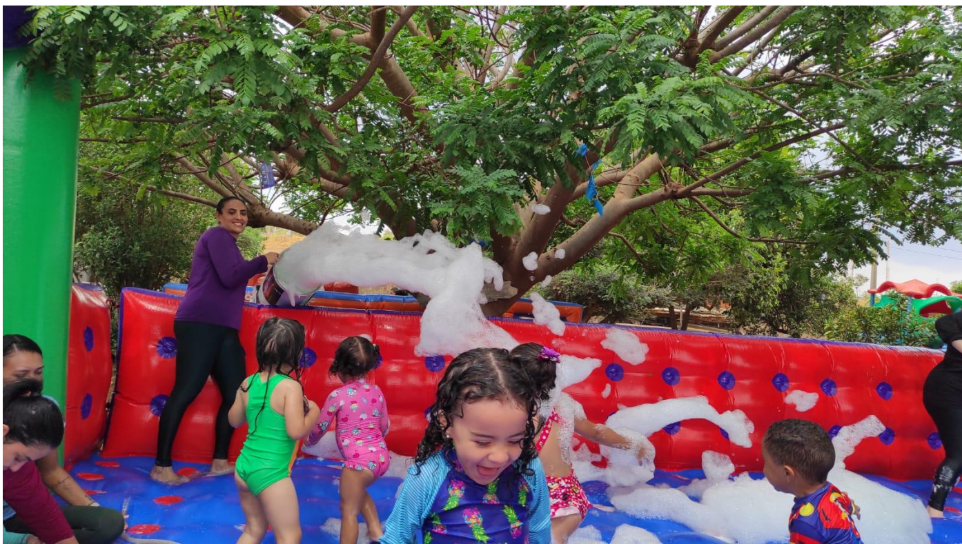
Semana da Criança