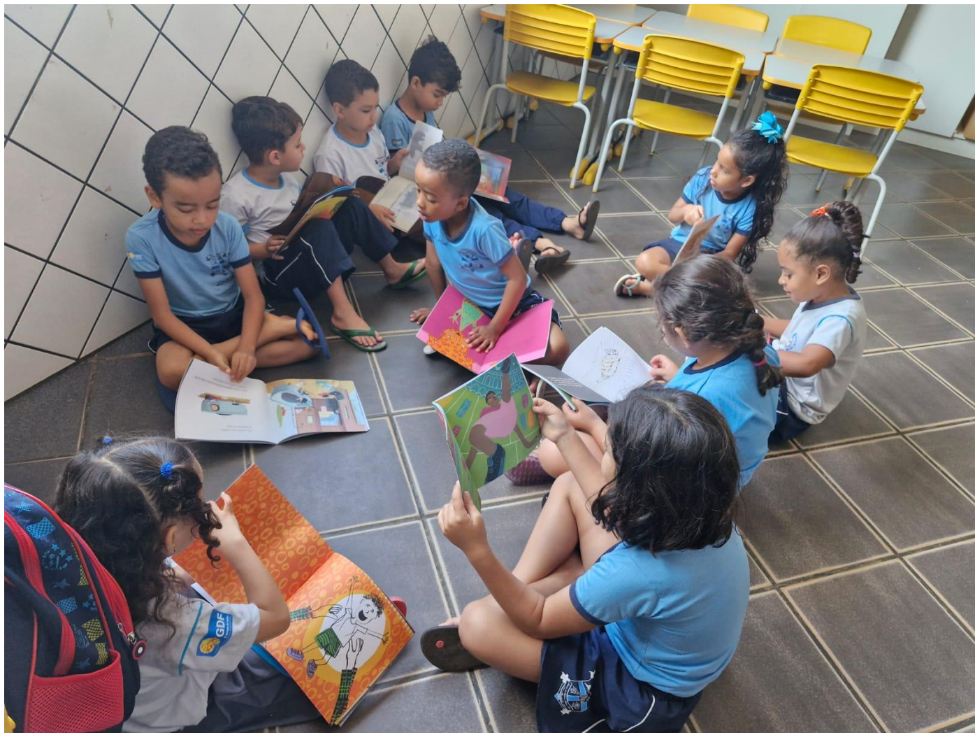
Semana do livro e da biblioteca