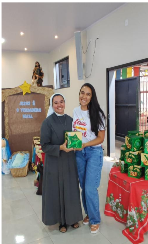
Confraternização final com os colaboradores