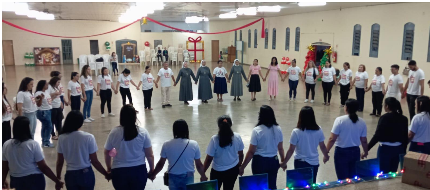
Auto de Natal