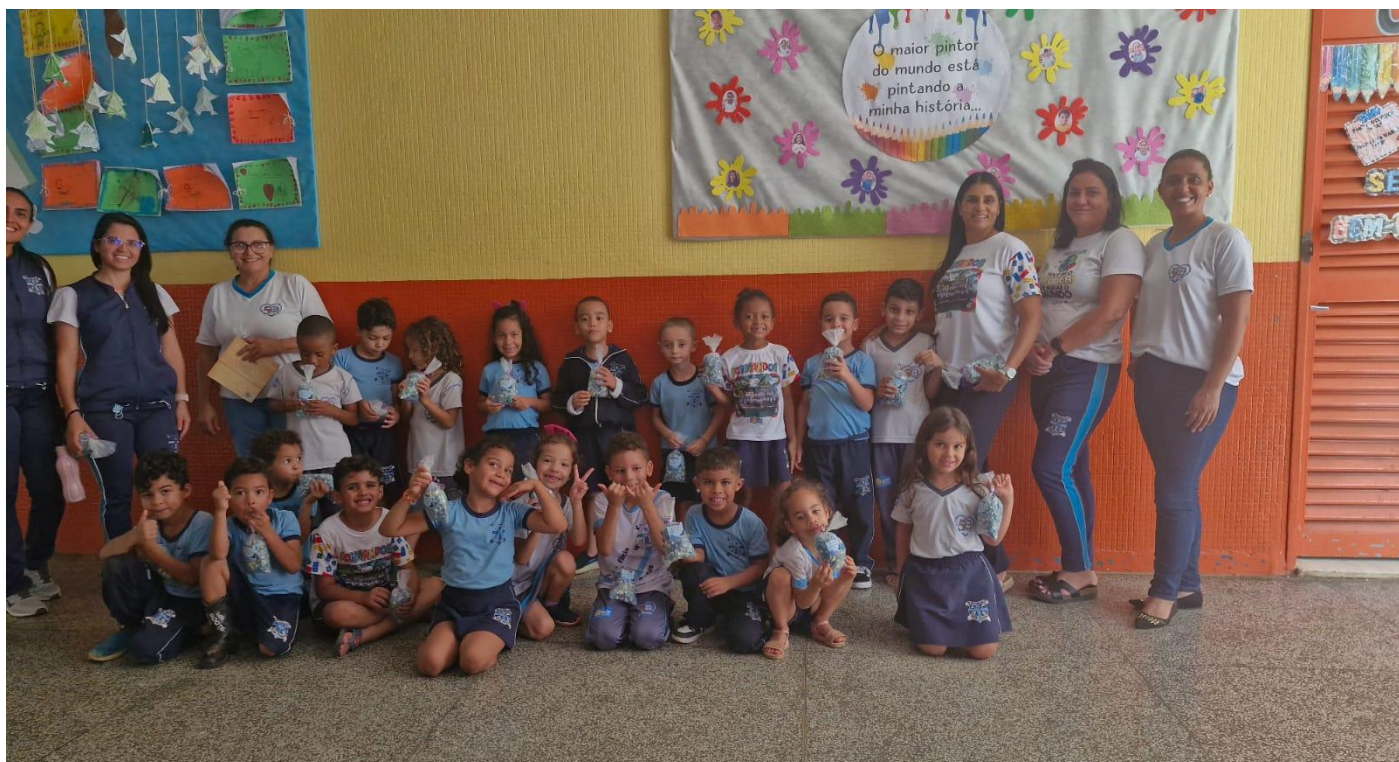
Projeto transição e campeonato de handebol