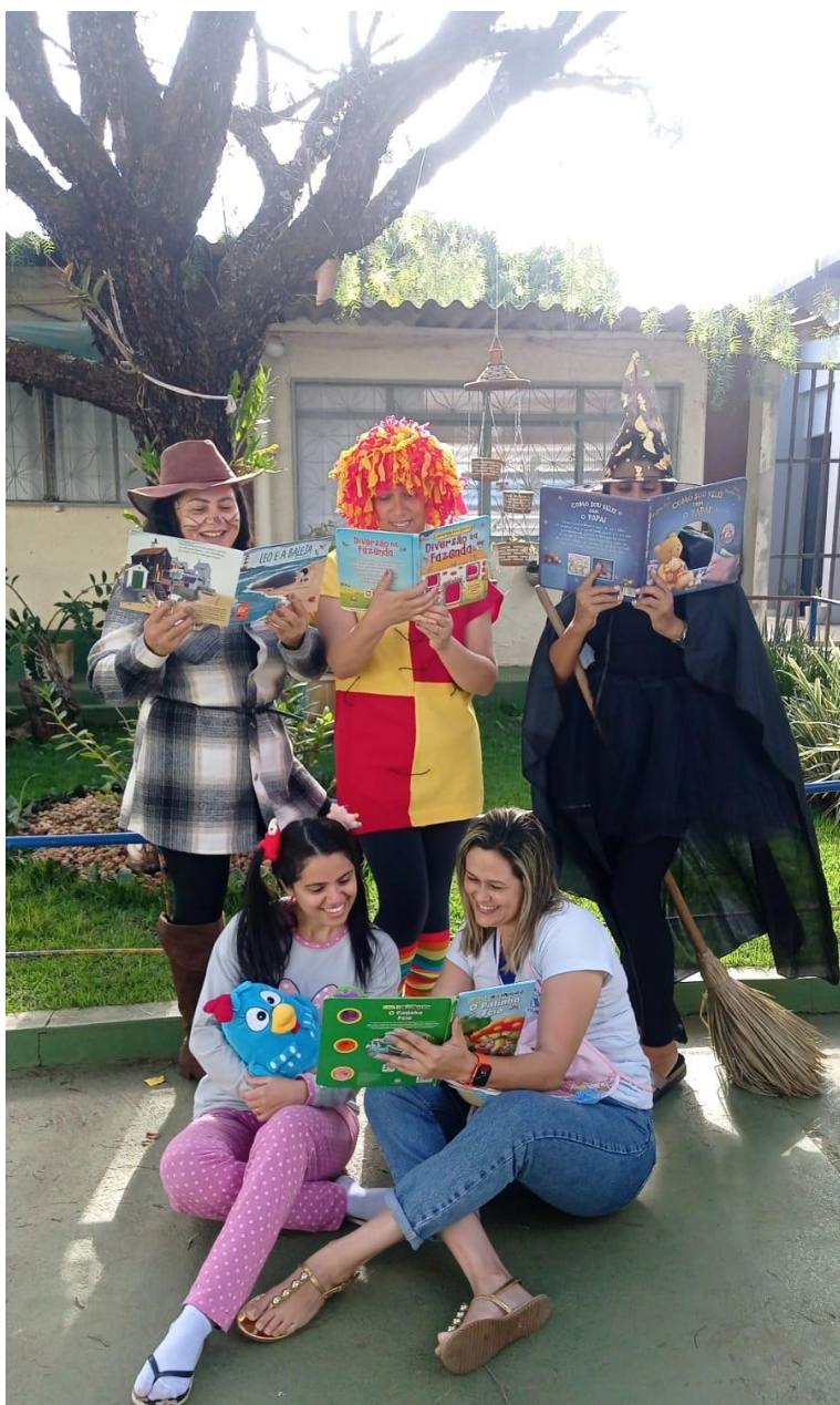
Semana do livro e da biblioteca