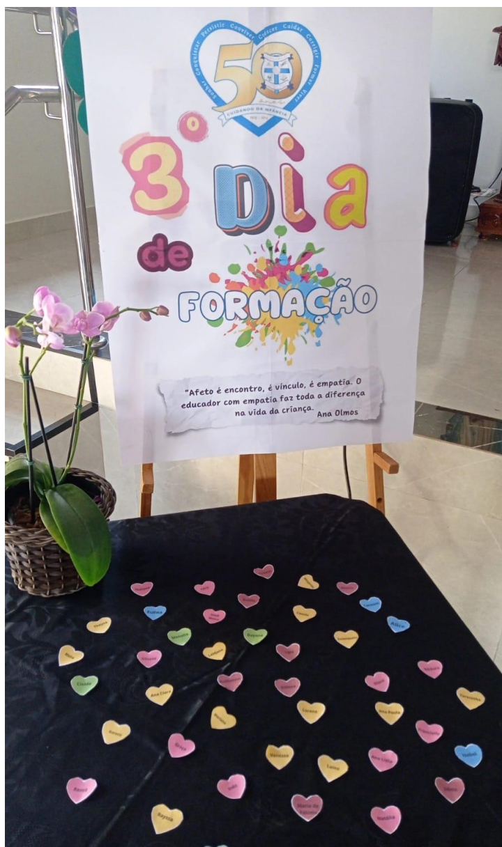
Dia de formação para profissionais da Educação Infantil