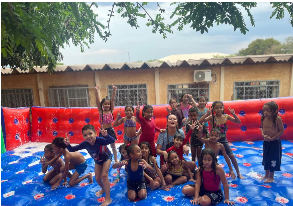
Semana da Criança