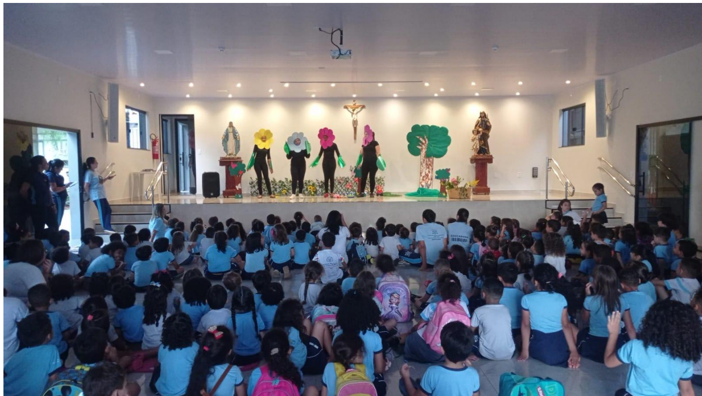
Semana do livro e da biblioteca