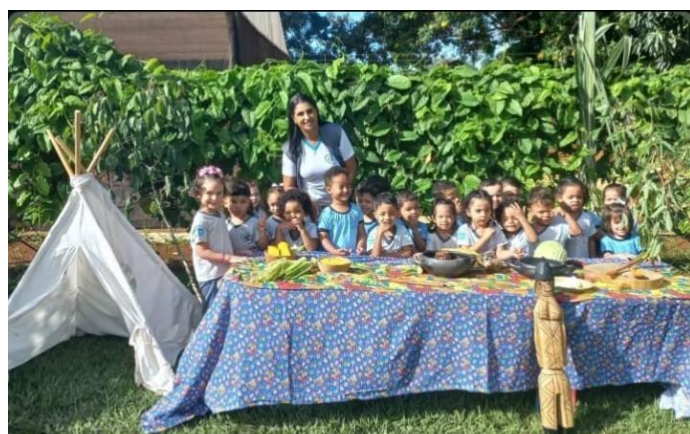
Exposição e degustação