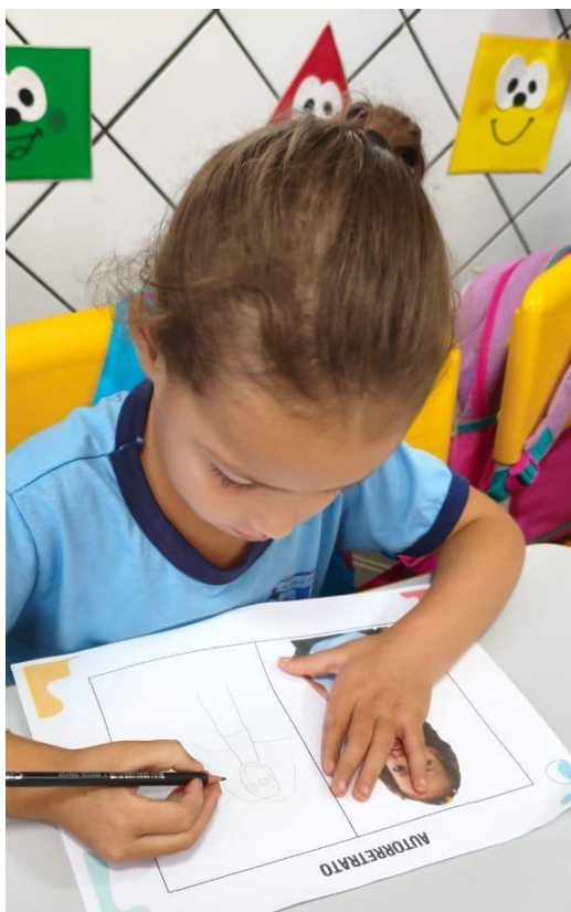
Projeto identidade- Eu sou assim, você?